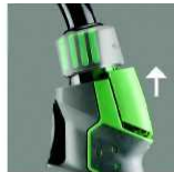
Remove the cover