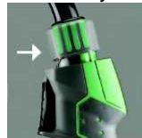
Turn the fitting

Горелка MIG-A Twist® может оснащаться 3 типами быстросъемных модулей управления Любой модуль легко заменить обычным ручным способом.